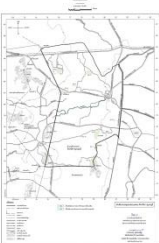
แผนผังแสดงที่โล่ง