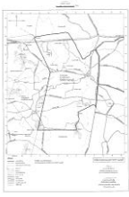
แผนที่แสดงเขตท้องที่ที่จะวาง และจัดทำผังเมืองรวม