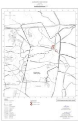
แผนผังแสดงโครงการคมนาคมและขนส่ง