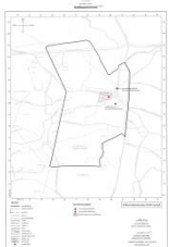
แผนผังแสดงโครงการกิจการ สาธารณูปโภค